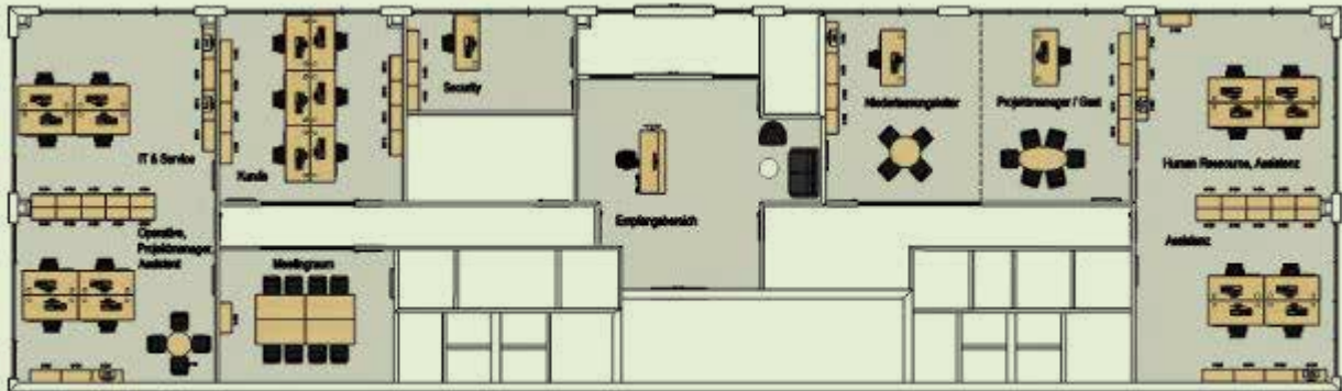
Bürogebäude 1.Etage und Sozial